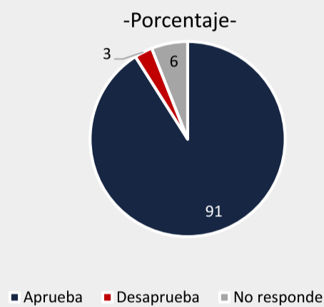
Aprobación de la labor del Presidente Nayib Bukele

El Salvador, diciembre. El 91% de los salvadoreños aprueba la gestión del Presidente Bukele al frente del poder ejecutivo. Lo anterior es el resultado del último estudio de opinión pública realizado a nivel nacional, con una muestra de 1200 personas de 18 años y más de edad, realizado entre el 2 y 8 de diciembre del corriente. Estos resultados, congruentes en los distintos grupos de la sociedad, se dan posterior a su visita a China, en la cual logró consolidar las relaciones con el país asiático y obtener distintas ayudas para El Salvador. Además, mantiene los niveles de respaldo que recibió a sus 100 días de haber tomado posesión del cargo, siendo las calificaciones más altas observadas internacionalmente por esta empresa.